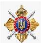
Управління державної охорони України