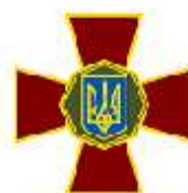
Національна гвардія України