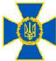
Служба безпеки України