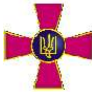
Збройні сили України