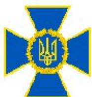
Служба безпеки України