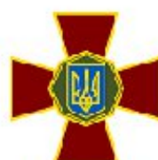
Національна гвардія України