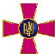
Збройні сили України