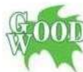
Загородный клуб GOOD WOOD