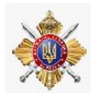
Управління державної охорони України