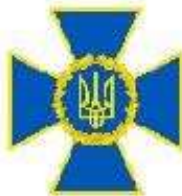
Служба безпеки України