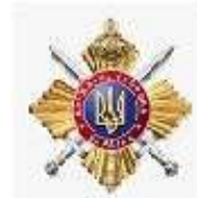
Управління державної охорони України