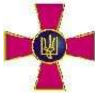
Збройні сили України