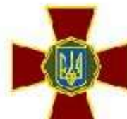
Національна гвардія України