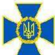
Служба безпеки України