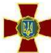
Національна гвардія України