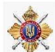
Управління державної охорони України