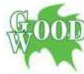
Загородний клуб GOOD WOOD