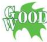
Загородний клуб GOOD WOOD