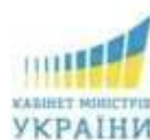
Кабінет міністрів України