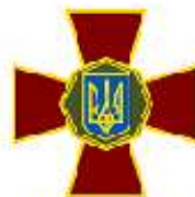
Національна гвардія України