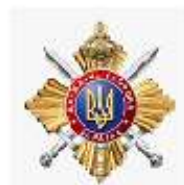
Управління державної охорони України