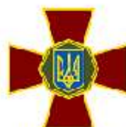
Національна гвардія України