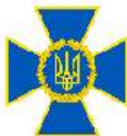
Служба безпеки України