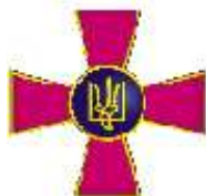
Збройні сили України