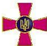
Збройні сили України