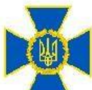
Служба безпеки України