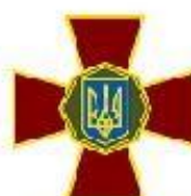
Національна гвардія України