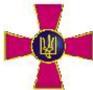
Збройні сили України