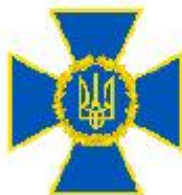
Служба безпеки України