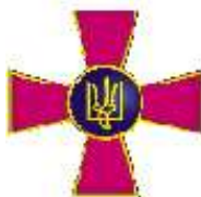
35-й піхотний полк України