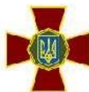
Національна гвардія України