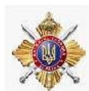
Управління державної охорони України