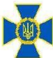
Служба безпеки України