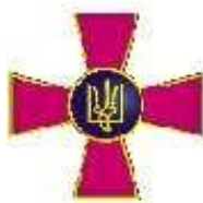
Збройні сили України