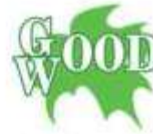
Загородный клуб GOOD WOOD