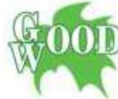
Загородный клуб GOOD WOOD