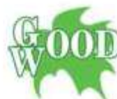
Загородный клуб GOOD WOOD