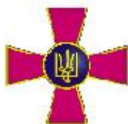
Збройні сили України